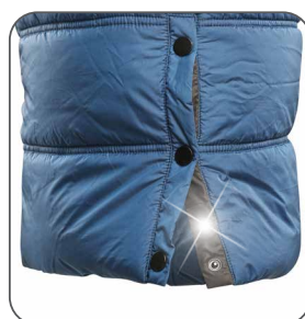
boční rozparek bočný rozparok side slit with boczne rozcięcie