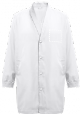
SÍTOTISK (TEXTIL) Parka | Chest 100 x 100 mm