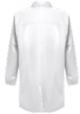
VÝŠIVKA Parka | Zadní část 280 x 70 mm