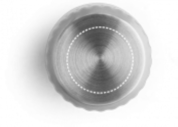
GRAVÍROVÁNÍ LASEREM Termoláhev | uzávěr láhve ø 20 mm