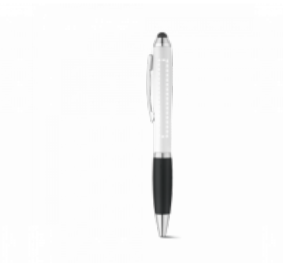
TAMPONTISK Kuličkové pero | tělo 55 x 6 mm