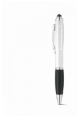
DIGITÁLNÍ UV TISK Kuličkové pero | tělo 35 x 7 mm