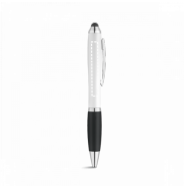
TAMPONTISK Kuličkové pero | Tělo 2 55 x 6 mm