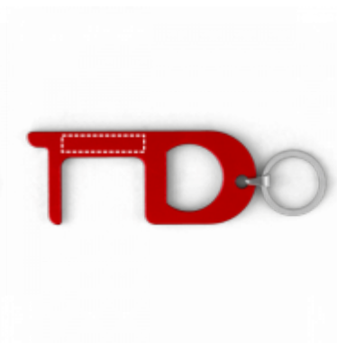
SÍTOTISK (PLAST, PAPIR) Přívěsek na klíče | Zadní část 30 x 6 mm