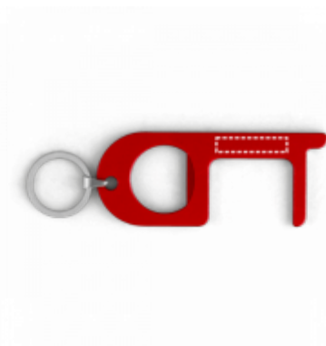
SÍTOTISK (PLAST, PAPIR) Přívěsek na klíče | Střed 30 x 6 mm