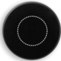
GRAVÍROVÁNÍ LASEREM Termoláhev | uzávěr láhve ø 20 mm