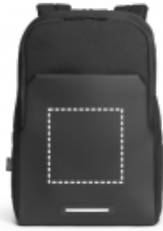
DIGITÁLNÍ TRANSFER Batoh | Prostřední kapsa 150 x 150 mm