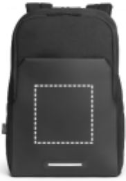
TRANSFER Batoh | Prostřední kapsa 150 x 150 mm