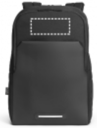
DIGITÁLNÍ TRANSFER Batoh | Přední horní část 150 x 60 mm