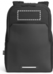
TRANSFER Batoh | Přední horní část 150 x 60 mm