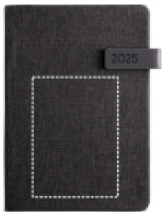
TRANSFER Notebook | Střed 100 x 140 mm