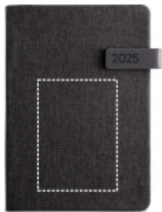
DIGITÁLNÍ TRANSFER Notebook | Střed 100 x 140 mm