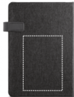
TRANSFER Notebook | Zadní část 100 x 140 mm